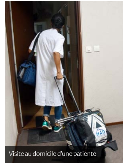
Visite au domicile d'une patiente