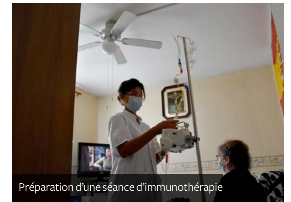
Préparation d'une séance d'immunothérapie

+ de 90 admissions par mois depuis Janvier 2022 (en moyenne)