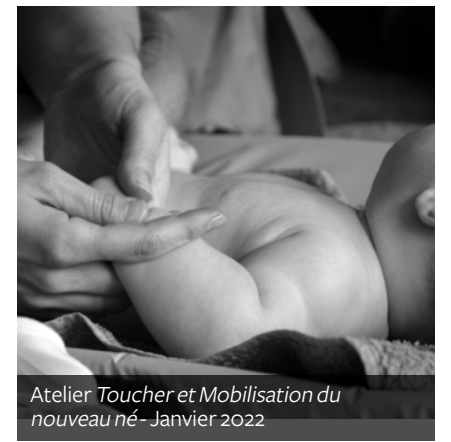
Atelier Toucher et Mobilisation du nouveau-né - Janvier 2022

Aussi renommé l'atelier "massages bébé", il offre l'occasion aux parents d'apprendre des techniques et des soins pour soulager leur enfant des petits maux du quotidien. Parmi eux, nous retrouvons les coliques, les douleurs liées à la croissance, à la constipation... Objectif pour les parents : mettre en pratique en autonomie dans le cocon familial les différents mouvements acquis pour créer son propre rituel et accompagner sereinement le développement du nourrisson. ■