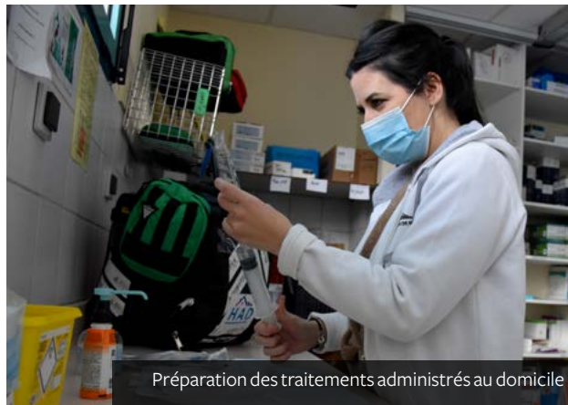
Préparation des traitements administrés au domicile

L'HAD s'adresse à tout patient atteint d'une pathologie grave, aiguë ou nécessitant des soins répétés (chimiothérapie, soins post-chirurgicaux, soins palliatifs...). Elle assure des soins médicaux et paramédicaux importants sur le lieu de résidence du patient, sans condition d'âge, pour une période donnée (renouvelable en fonction de l'évolution de l'état de santé). L'HAD de Pau intervient sur 68 communes béarnaises , organisée autour d'une coordination de professionnels salariés et libéraux.