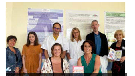
Equipe ayant participé à l'élaboration de la BD pédagogique pour les enfants

Ce projet a pu voir le jour grâce au soutien financier de l'Association KOALA. ■